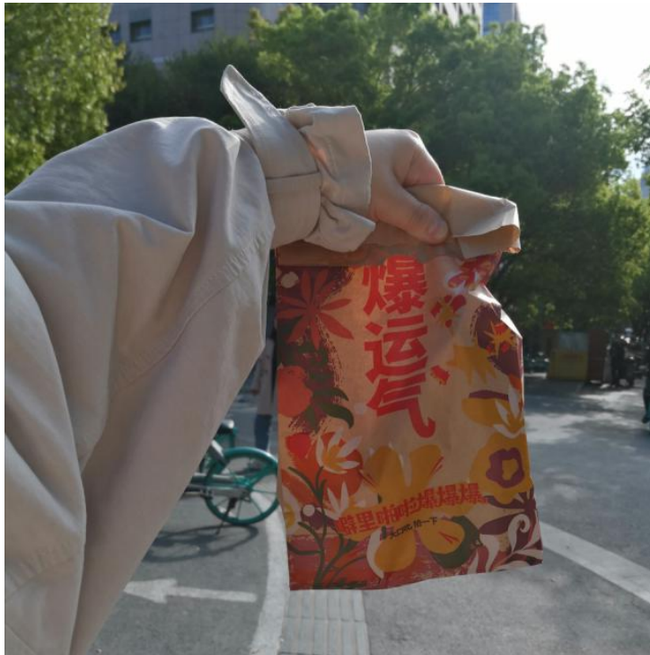
在南京准备面试时的早饭

四月份的南京有些凉，却已经春意盎然，准备面试期间，她不断地磨课、练课、写教案、练粉笔字。她将自己当作一无所知的外行人，从零开始准备，放空自己，以求获得更加饱满的知识。之所以这样做，也是因为在大四上学期，被专业课老师批评“你不会上课”，同时在论文的进展上也十分的不如意，甚至在临近面试时，眼镜突然折断了。种种压力下，破釜沉舟的她在大学最后的日子收获了成功入编的消息。五月份快到了，天气越来越好，她开始对自己的教师生涯充满着期待。